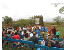
Пушкинский праздник в Танаисе

Узел «Танаис» является начальным пунктом маршрута «Миусская стрела».